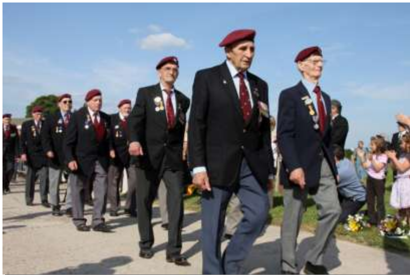
Vétérans du 9 e Bataillon de Parachutistes Britanniques

35- Quel est le personnage représenté par le buste ?